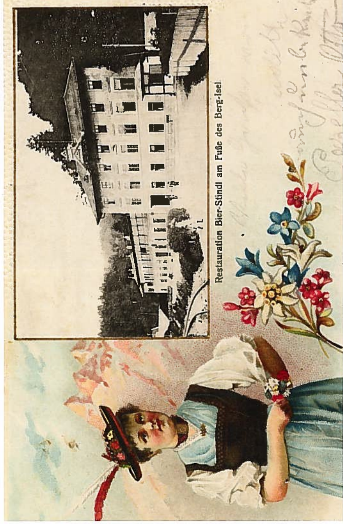
Restauration Bier-Stindl am Fuße des Berg-Isel.

Das Bierstindl war schon immer ein beliebter Blickfang in Innsbruck. Als Innsbrucker Ansicht machte es auf Postkarten Furore.